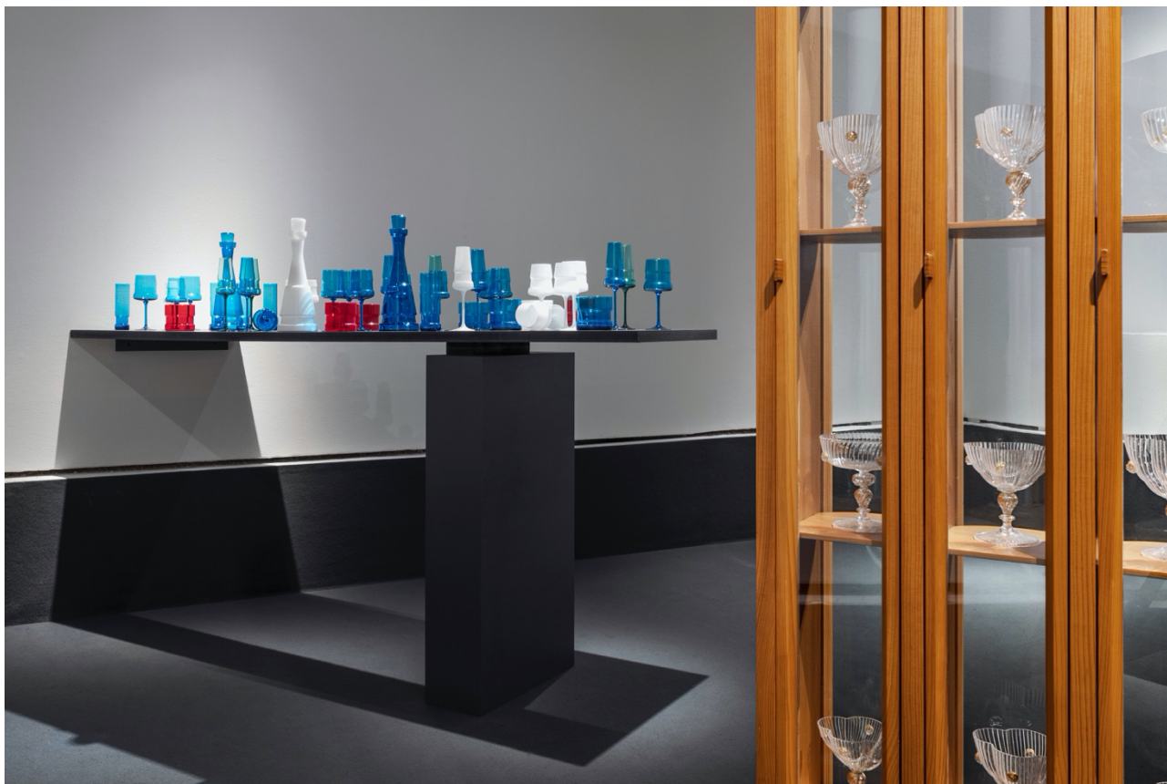
Veduta dell'esposizione con Mosquito e Quadrifoglio .